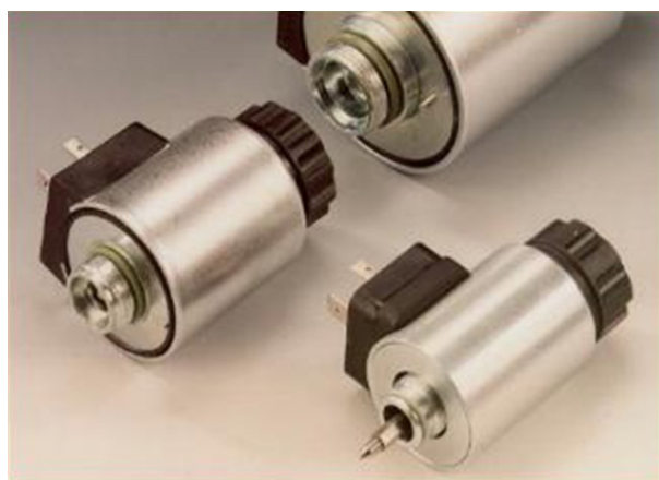
Рисунок 2 – Электромагнит для гашения угловой скорости вращения КА

Второй способ демпфирования колебаний гравитационно-стабилизированного КА реализуется с помощью магнитных стержней, изготовленных