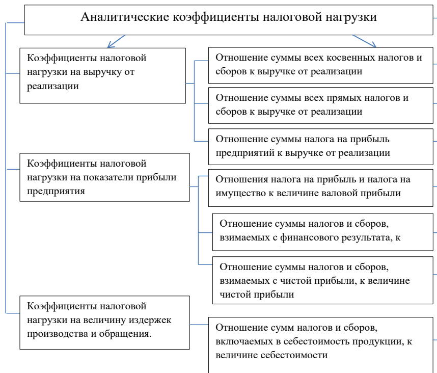
Рисунок 2 – Аналитические коэффициенты налоговой нагрузки деятельности торгового малого предприятия для оценки отрасли в регионе

в регионе использовать следующие показатели, с помощью которых можно успешнее и своевременно выявлять риски недополучения поступлений в местный бюджет, ухудшения инвестиционного климата и экономической эффективности деятельности торговых предприятий малого бизнеса, которые представлены в таблице 1.