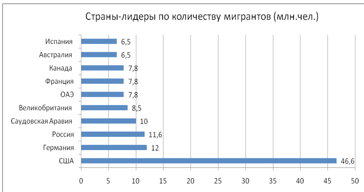
Рисунок 1 – Государства-лидеры по числу мигрантов (в млн. чел.)

На протяжении развития мировой цивилизации, миграция была и остается неотъемлемой частью и фактором обеспечения региональной и