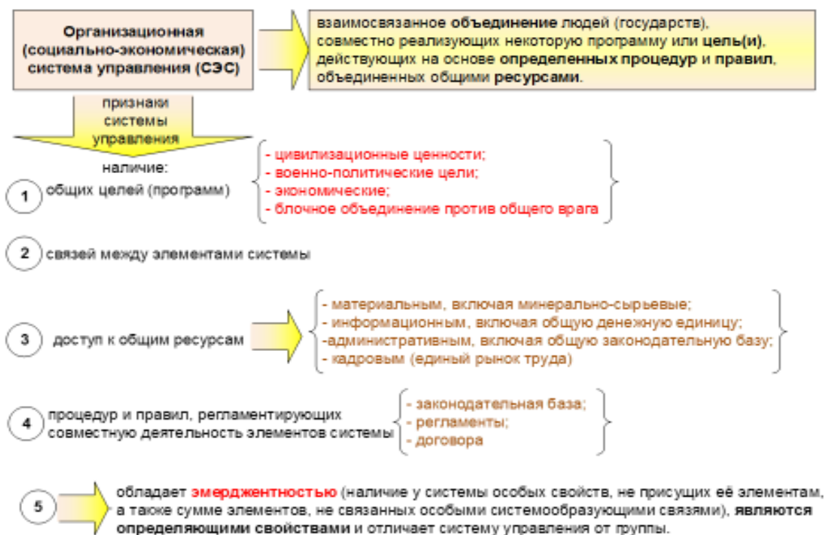
Рисунок 5 – Интеграция в систему управления