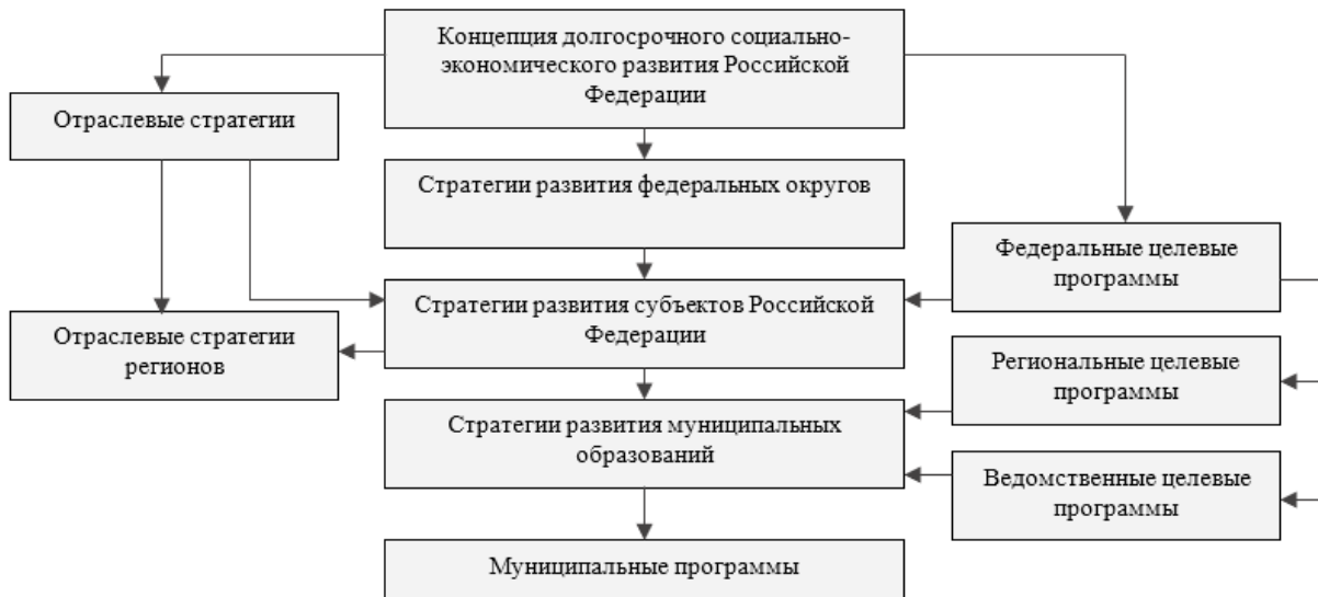
Рисунок 1 – Иерархия основополагающих документов стратегического социально-экономического развития

соответствующие стратегии социально-экономического развития макрорегионов (федеральных округов) до 2020 г. (или до 2025 г.), прогноз социально-экономического развития Российской Федерации на период до 2036 г., прогноз долгосрочного социально-экономического развития Российской Федерации на период до 2030 года, прогноз социально-экономического развития Российской Федерации на период до 2024 года, бюджетный прогноз Российской Федерации на период до 2036 г., различные государственные программы, а также схемы территориального планирования Российской Федерации. Соответственно органам власти и управления на региональном уровне при разработке стратегических документов в области СЭР необходимо руководствоваться обширным перечнем нормативных актов.