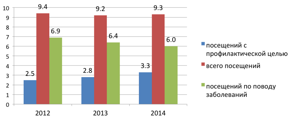
Диаграмма 1 – Структура посещений врачей амбулаторно-поликлинического звена в 2012-2014 г.г. в Белгородской области

диспансеризации обследовано 13,8% населения, а граждан, проживающих в сельской местности, – 44,6%. Доля отказов от отдельных исследований составила 4,3%, а доля письменных отказов от диспансеризации в целом – 1,3%.